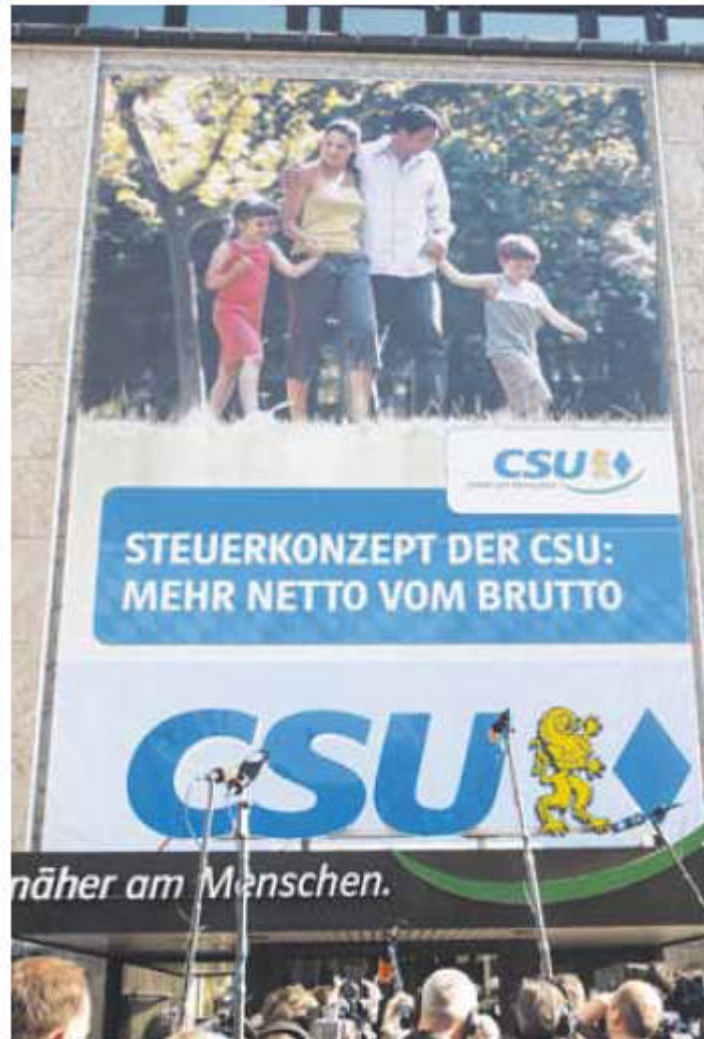
Seit Jahren ein Versprechen der CSU in Wahlkämpfen: Den Menschen soll mehr netto vom Brutto in der Tasche bleiben.